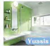
Yuasis 1616 サイズ