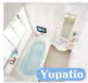
Yupatio 1616 サイズ