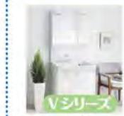
Vシリーズ 750 サイズ