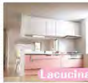
Lacucina I型 2550