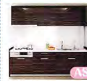
AS I型 2550