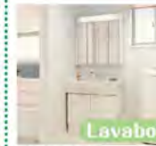
Lavabo 750 サイズ